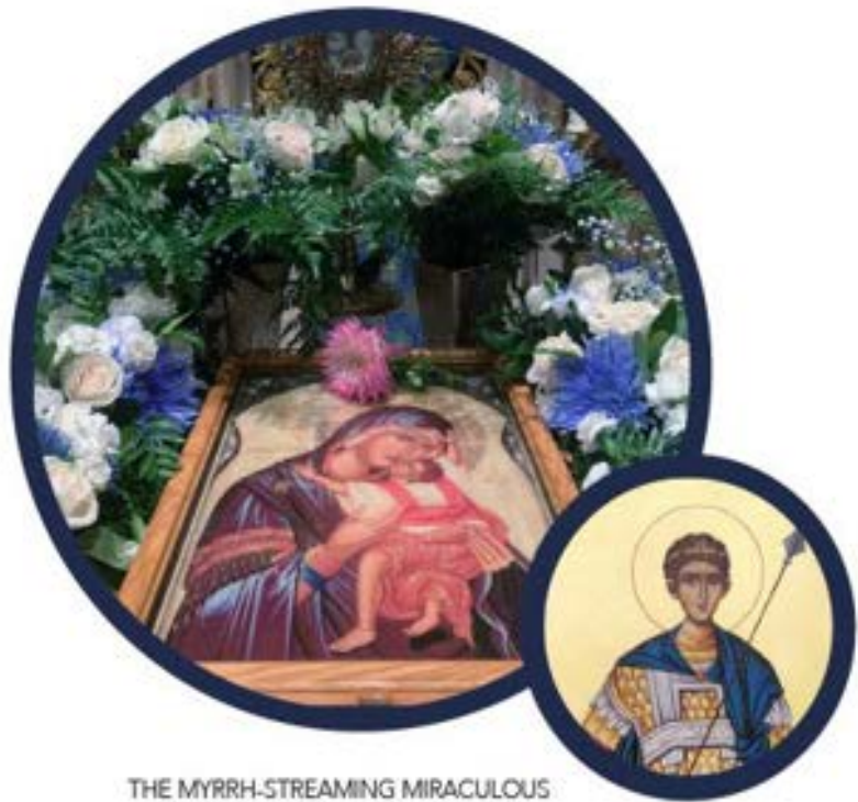
THE MYRRH-STREAMING MIRACULOUS ICON OF PANAGIA KARDIOTISSA [THE TENDER HEART]

– Following, a reception for all at the Patrides Hall